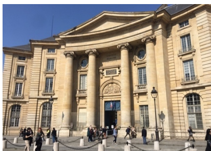
12, place du Panthéon.