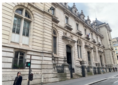
133, rue Saint Jacques